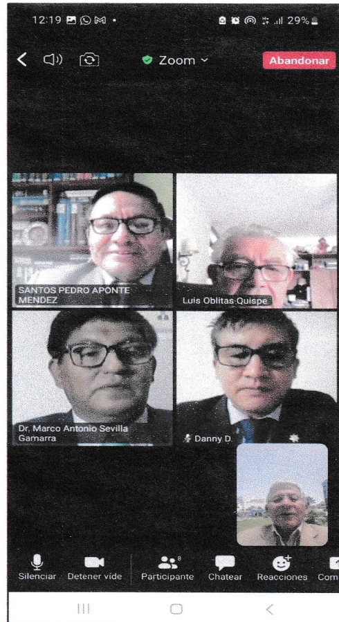
Foto de Sesión del Comité de Ética en la Investigación del 30 de junio del 2023.